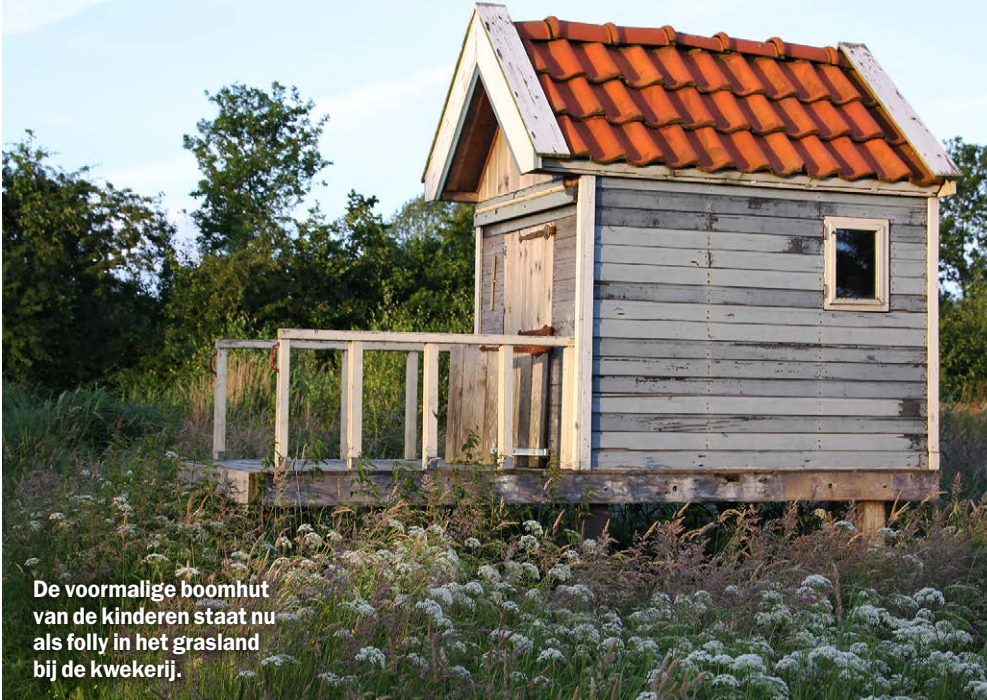
De voormalige boomhut van de kinderen staat nu als folly in het grasland bij de kwekerij.