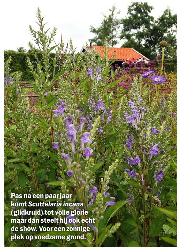
Pas na een paar jaar komt Scutellaria incana (glidkruid) tot volle glorie maar dan steelt hij ook echt de show. Voor een zonnige plek op voedzame grond.