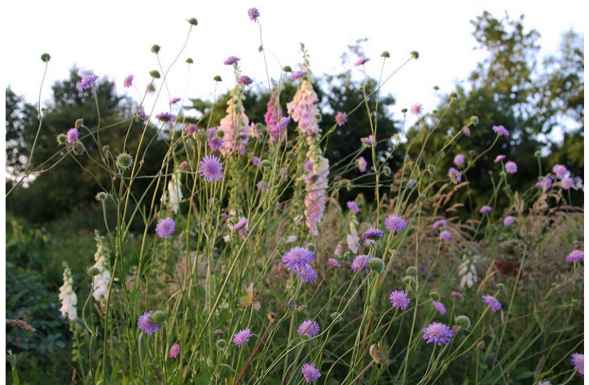
Door zijn nonchalante uitstraling en lange bloei past Scabiosa 'Butterfly Blue' (duifkruid) perfect in een cottagetuin.

Wie meer wil dan een advies kan bij Joukje terecht voor een tuinontwerp inclusief uitgekend beplantingsplan. Want het maken van een mooie border valt nog niet mee. Dat is iets waar zelfs veel plantenliefhebbers problemen mee blijken te hebben. Joukje: „Bij een border moet je rekening houden met hoogte, kleur, blad en bloei, schaduw en zon. Maar je moet ook structuurplanten als de kogeldistel toepassen om de border vorm te geven. En een