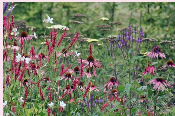
Een prachtige combinatie van Echinacea purpurea 'Magnus', Persicaria amplexicaulis 'Orange Field', Gaura lindheimeri 'Whirling Butterflies', Verbena hastata en een uitgezaaide Achillea .