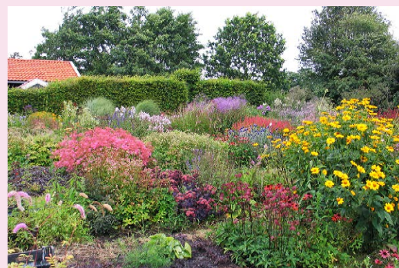
Het kweekveld is 's zomers een prachtige bloemenzee. Bezoekers mogen hier tussen de bedden doorlopen.