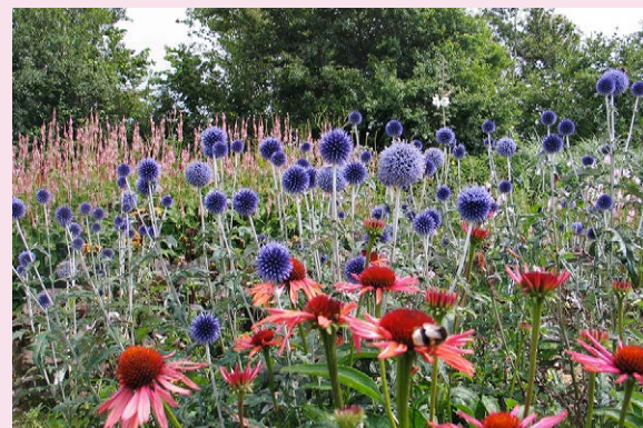
Zowel Echinops ritro 'Veitch's Blue' (kogeldistel) als Echinacea 'Sundown' (zonnehoed) houden van een plek in de volle zon.