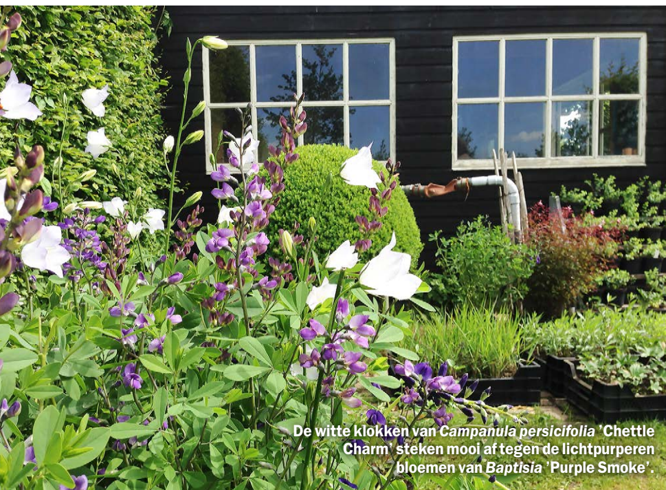
De witte klokken van Campanula persicifolia 'Chettle Charm' steken mooi af tegen de lichtpurperen bloemen van Baptisia 'Purple Smoke'.

border moet het hele jaar mooi zijn, dus vroeg beginnen en lang doorgaan, zoals dat met grassen kan bijvoorbeeld. Weefplanten zijn echt heel leuk om toe te passen, die maken een border snel wat natuurlijker.”