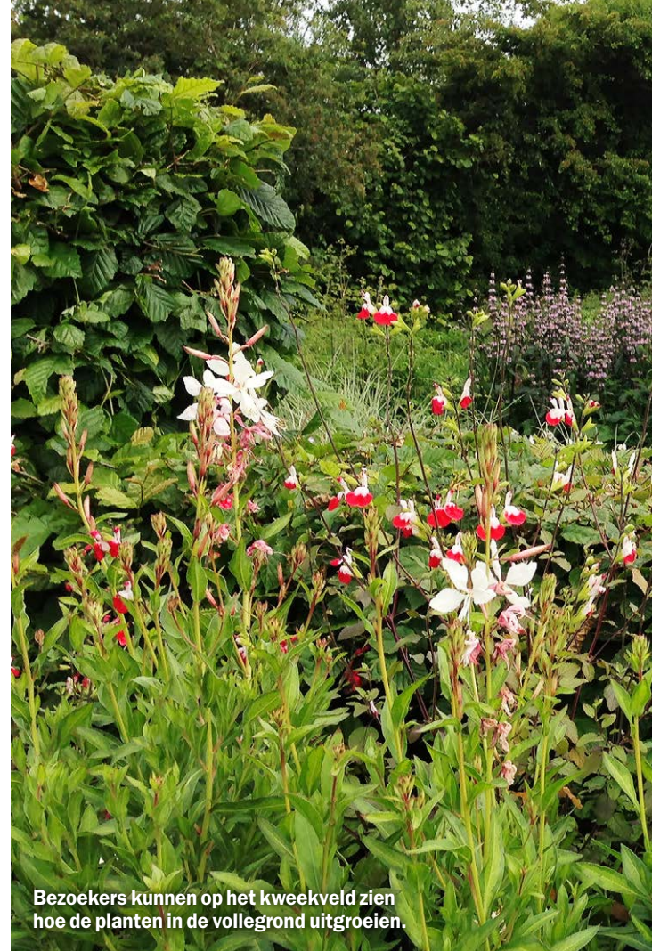
Bezoekers kunnen op het kweekveld zien hoe de planten in de volleggrond uitgroeien.