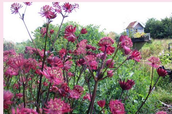
Op voedzame, vochthoudende grond wordt Astrantia major 'Ruby Star' (Zeeuws knoopje) wel 1 m hoog.